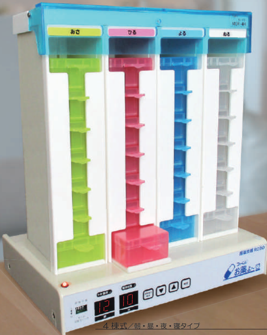
4 棟式 / 朝・昼・夜・寝タイプ MOR-4, MOR-4S (音声) MOR-4H (音声・見守り)