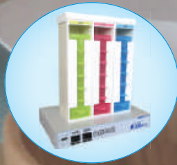
3 棟式 / 朝・昼・夜タイプ MOR-3