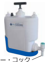
フィルター・コック